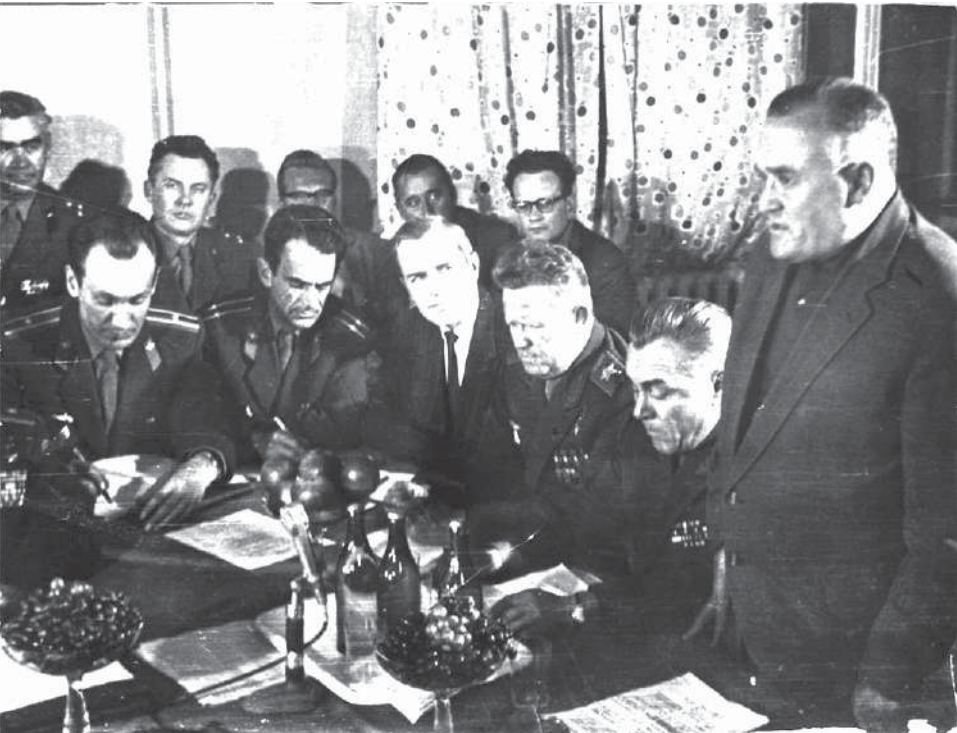
С.П. Королёв проводит совещание