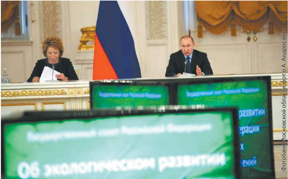
Владимир Путин провёл заседание Госсовета

Полигоны, где захоронены твёрдые коммунальные отходы, не только занимают полезную площадь, но и создают значительную опасность для окружающей среды. Многие из них на сегодняшний день расположены в опасной близости от населённых пунктов, негативно влияя на здоровье людей. «Мы здесь задыхаемся!» – такие слова можно услышать