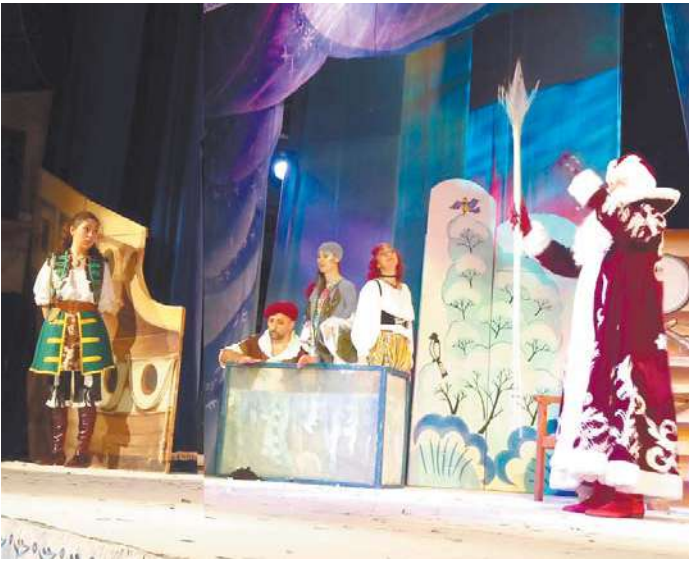
Сцена из спектакля «Пиратский Новый год»

В ПЕРИОД С 31 ДЕКАБРЯ 2016 ГОДА ПО 9 ЯНВАРЯ 2017 ГОДА В ДЕЖУРНЫЕ ЧАСТИ УМВД Г.О. КОРОЛЁВА ПОСТУПИЛО 1028 СООБЩЕНИЙ О ПРОИСШЕСТВИЯХ, В ТОМ ЧИСЛЕ 34 – О СОВЕРШЁННЫХ ПРЕСТУПЛЕНИЯХ.