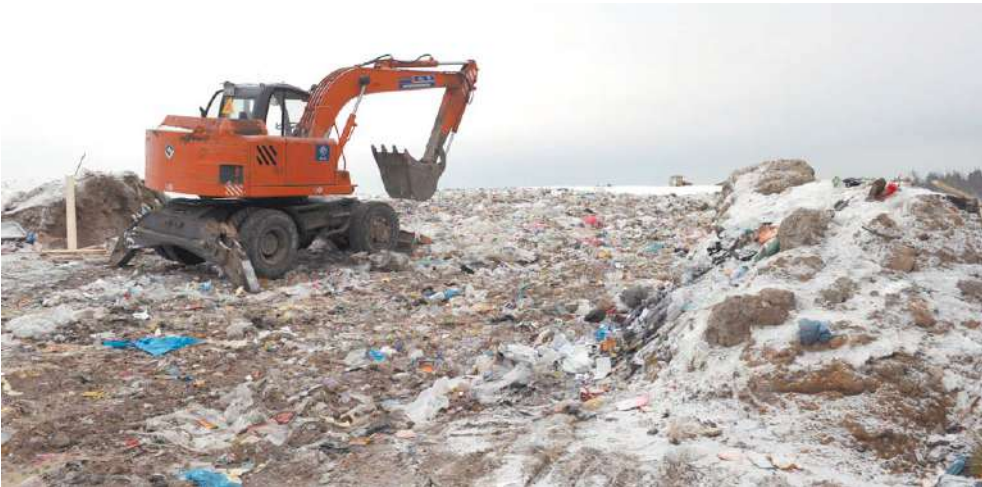
На территорию московского региона ежегодно вывозится более 10 млн тонн мусора

Закопать и забыть – именно такой «дедовский» способ утилизации мусора используется сейчас повсеместно. По официальным данным, в России вывозится на полигоны для захоронения до 95% всех производимых твёрдых коммунальных отходов. При этом можно ожидать, что уже в ближайшие годы участки для захоронения мусора, существующие на данный момент, переполнятся. Так, мощности 19 полигонов, которые функционируют сейчас на территории Московской области, по оценкам специалистов, хватит на 2,5–3 года. Напомним, на территории московского региона ежегодно вывозится более 10 млн тонн мусора. Если оставить