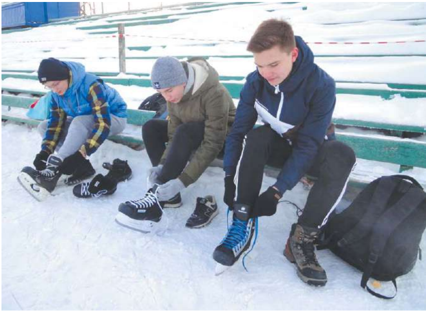
На катке стадиона «Металлист»

В ПРАЗДНИЧНЫЕ ДНИ СВЫШЕ 1000 ЧЕЛОВЕК ЕЖЕДНЕВНО ПОСЕЩАЛИ КАТОК НА СТАДИОНЕ «МЕТАЛЛИСТ».